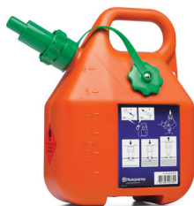
KANYSTR NA BENZÍN, 6 L, ORANŽOVÝ 505 69 80-01