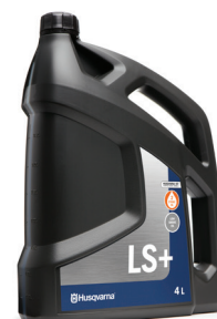
DVOUTAKTNÍ OLEJ, LS+ 578 03 71-02