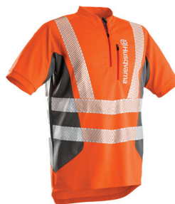
PRACOVNÍ TRIKO S KRÁTKÝM RUKÁVEM TECHNICAL, REFLEXNÍ 596 30 39-54