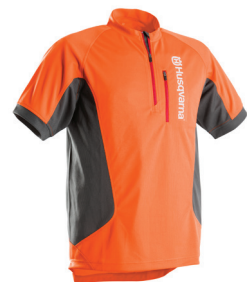
PRACOVNÍ TRIKO S KRÁTKÝM RUKÁVEM TECHNICAL 501 71 59-62