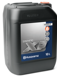
DVOUTAKTNÍ OLEJ, XP® SYNTHETIC 578 18 00-03