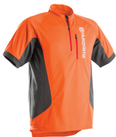
PRACOVNÍ TRIKO S KRÁTKÝM RUKÁVEM TECHNICAL 501 71 59-46