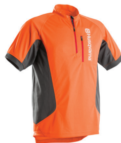
PRACOVNÍ TRIKO S KRÁTKÝM RUKÁVEM TECHNICAL 501 71 59-58