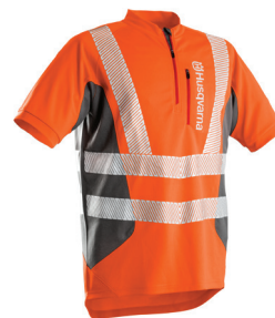
PRACOVNÍ TRIKO S KRÁTKÝM RUKÁVEM TECHNICAL, REFLEXNÍ 596 30 39-58