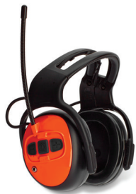
CHRÁNIČE SLUCHU S FM RÁDIEM 578 27 49-03