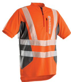
PRACOVNÍ TRIKO S KRÁTKÝM RUKÁVEM TECHNICAL, REFLEXNÍ 596 30 39-50