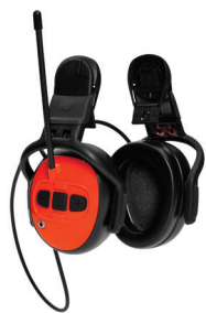
CHRÁNIČE SLUCHU S FM RÁDIEM 578 27 49-04