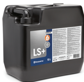
DVOUTAKTNÍ OLEJ, LS+ 578 18 00-02