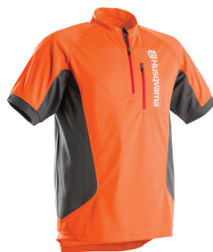
PRACOVNÍ TRIKO S KRÁTKÝM RUKÁVEM TECHNICAL 501 71 59-54