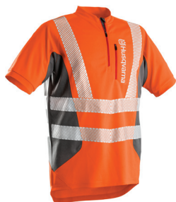
PRACOVNÍ TRIKO S KRÁTKÝM RUKÁVEM TECHNICAL, REFLEXNÍ 596 30 39-66