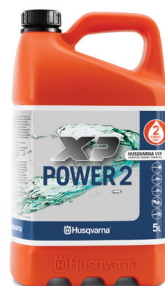
ALKYLÁTOVÉ PALIVO HUSQVARNAHUSQVARNA XP POWER 2T 583 95 29-01