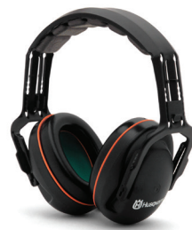
CHRÁNIČE SLUCHU 505 66 53-04