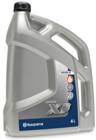
DVOUTAKTNÍ OLEJ, XP® SYNTHETIC 578 03 71-03