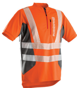
PRACOVNÍ TRIKO S KRÁTKÝM RUKÁVEM TECHNICAL, REFLEXNÍ 596 30 39-62