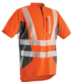
PRACOVNÍ TRIKO S KRÁTKÝM RUKÁVEM TECHNICAL, REFLEXNÍ 596 30 39-46