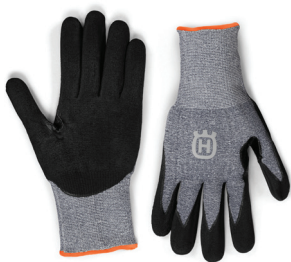
RUKAVICE TECHNICAL GRIP 529 88 03-10