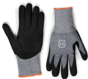
RUKAVICE TECHNICAL GRIP 529 88 03-08