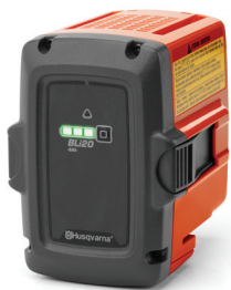
AKUMULÁTOR HUSQVARNA BLI20