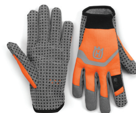
RUKAVICE FUNCTIONAL LIGHT VENT