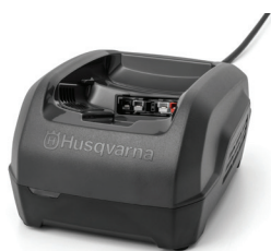
NABÍJEČKA HUSQVARNA QC250