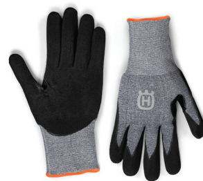
RUKAVICE TECHNICAL GRIP 529 88 03-12