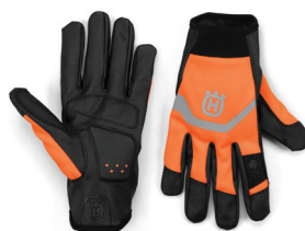
RUKAVICE FUNCTIONAL LIGHT NON-SLIP