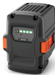
AKUMULÁTOR HUSQVARNA 40-B70