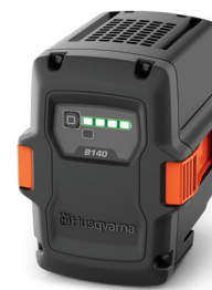
AKUMULÁTOR HUSQVARNA 40-B140