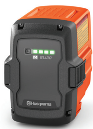
AKUMULÁTOR HUSQVARNA BLI30