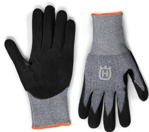
RUKAVICE TECHNICAL GRIP 529 88 03-09