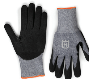
RUKAVICE TECHNICAL GRIP