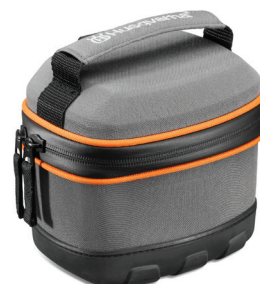
OBAL NA AKUMULÁTOR HUSQVARNA 585 37 18-01