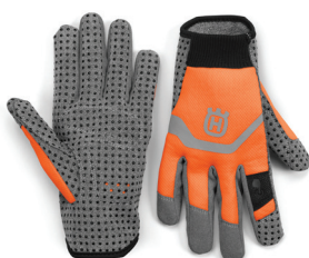
RUKAVICE FUNCTIONAL LIGHT VENT