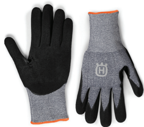
RUKAVICE TECHNICAL GRIP 529 88 03-08