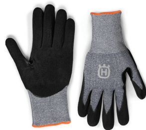
RUKAVICE TECHNICAL GRIP 529 88 03-10