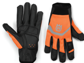
RUKAVICE FUNCTIONAL LIGHT NON-SLIP