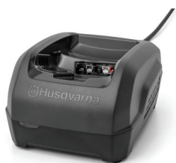
NABÍJEČKA HUSQVARNA QC250