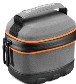
OBAL NA AKUMULÁTOR HUSQVARNA 585 37 18-01