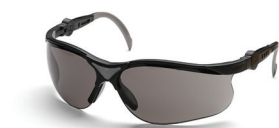
OCHRANNÉ BRÝLE SUN X 544 96 37-03