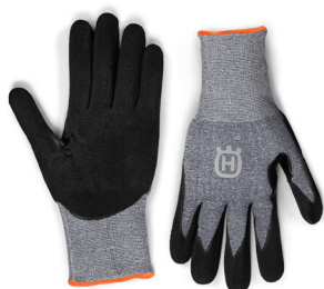
RUKAVICE TECHNICAL GRIP 529 88 03-12