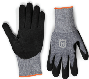
RUKAVICE TECHNICAL GRIP 529 88 03-07