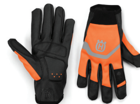
RUKAVICE FUNCTIONAL LIGHT NON-SLIP