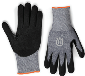
RUKAVICE TECHNICAL GRIP 529 88 03-09