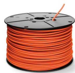
OHRANIČUJÍCÍ VODIČ PRO, 300 M, Ø 5,5 MM, ČERNÝ 593 29 77-02