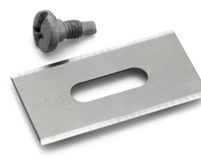
ŽACÍ BŘÍTY AUTOMOWER® ENDURANCE 595 08 44-02