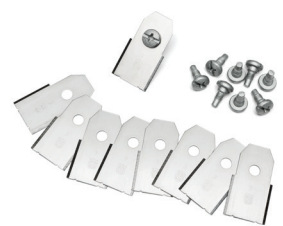
BEZPEČNÉ ŽACÍ BŘÍTY S DLOUHOU ŽIVOTNOSTÍ, 9 KS, UHLÍKOVÁ OCEĽ 577 86 46-03