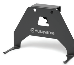
NÁSTĚNNÝ DRŽÁK PRO SEKAČKU AUTOMOWER® 597 70 36-01