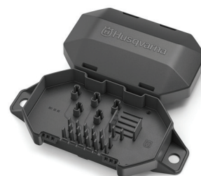
BOX NA OCHRANU KONEKTORŮ PRO AUTOMOWER® 599 80 17-01