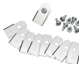
BEZPEČNÉ ŽACÍ BŘÍTY S DLOUHOU ŽIVOTNOSTÍ, 45 KS, UHLÍKOVÁ OCEĽ 0.60 MM 577 60 65-05