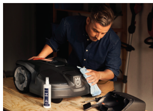
SADA NA ÚDRŽBU ROBOTICKÉ SEKAČKY 590 85 51-01