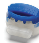
SPOJKA VODIČE, 100 KS 501 98 02-03