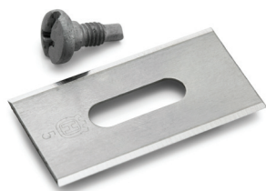
ŽACÍ BŘÍTY AUTOMOWER® ENDURANCE HSS, SADA 6 KS, BLISTER 599 80 52-01