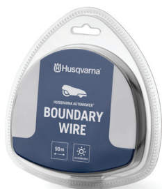
OHRANIČUJÍCÍ VODIČ STANDARD, ČERNÝ Ø 2,7 MM 597 23 78-02