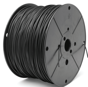
OHRANIČUJÍCÍ VODIČ HEAVY DUTY (VYSOCE ODOLNÝ), Ø 3,4 MM 522 91 41-02