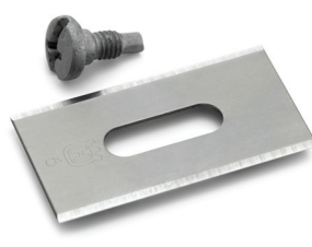
ŽACÍ BŘÍTY AUTOMOWER® ENDURANCE 595 08 44-01