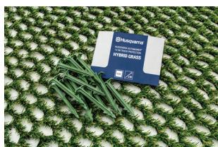
UMĚLÁ TRÁVA 1X1 METR 598 89 60-01