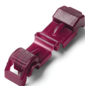
KONEKTOR 535 12 90-01