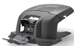
AUTOMOWER® HOUSE L - DOMEČEK PRO AUTOMOWER 585 01 94-01