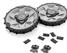
TERÉNNÍ SADA PRO AUTOMOWER® 581 88 97-02