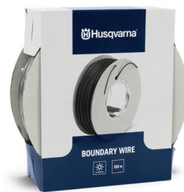
OHRANIČUJÍCÍ VODIČ STANDARD ČERNÝ, Ø 2,7 MM 597 23 78-01