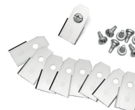
BEZPEČNÉ ŽACÍ BŘÍTY S DLOUHOU ŽIVOTNOSTÍ, 300 KS, UHLÍKOVÁ OCEĽ 0.60 MM 577 60 66-04