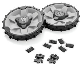
TERÉNNÍ SADA PRO AUTOMOWER® 597 70 54-01