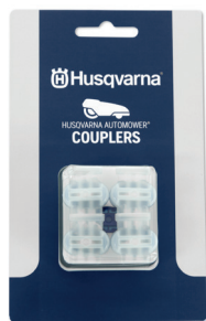
SPOJKA VODIČE SMYČKY, 5 KS 577 86 47-01