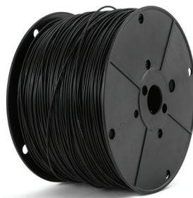
OHRANIČUJÍCÍ VODIČ STANDARD ČERNÝ, Ø 2,7 MM 580 66 20-09