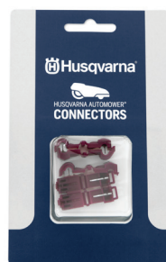
KONEKTOR PRO OHRANIČUJÍCÍ/NAVÁDĚCÍ VODIČE, 5 KS, BALENÍ BLISTR 577 86 48-01