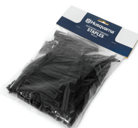
SKOBY PRO VYZNAČENÍ TRÁVNÍKU 577 86 42-01