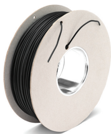
OHRANIČUJÍCÍ VODIČ STANDARD ČERNÝ, Ø 2,7 MM 580 66 20-06