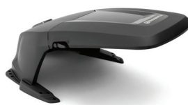
AUTOMOWER® HOUSE L - DOMEČEK PRO AUTOMOWER 597 63 53-01