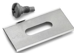
ŽACÍ BŘÍTY AUTOMOWER® ENDURANCE HSS 599 80 52-02