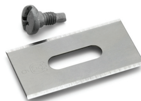
ŽACÍ BŘÍTY AUTOMOWER® ENDURANCE 595 08 44-03