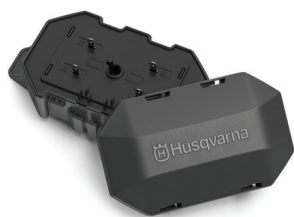
AREA PŘEPÍNAČ PRO HUSQVARNA AUTOMOWER® 529 45 97-01