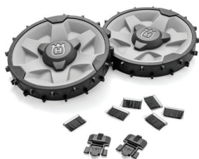
TERÉNNÍ SADA PRO AUTOMOWER® 587 23 53-01