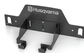
NÁSTĚNNÝ DRŽÁK PRO SEKAČKU AUTOMOWER® 585 01 97-02