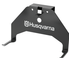
NÁSTĚNNÝ DRŽÁK PRO SEKAČKU AUTOMOWER® 587 22 40-01