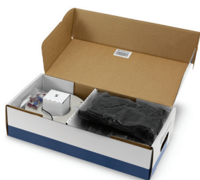
SADA PRO INSTALACI ROBOTICKÉ SEKAČKY, MALÁ, VČ. ČERNÉHO KABELU ODLNÉHO PROTI UV 967 97 21-01