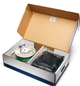
SADA PRO INSTALACI ROBOTICKÉ SEKAČKY 967 62 36-03