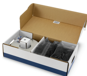
SADA PRO INSTALACI ROBOTICKÉ SEKAČKY, STŘEDNĚ VELKÁ, VČ. ČERNÉHO KABELU ODLNÉHO PROTI UV 967 97 22-01