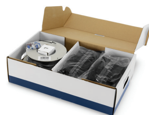
SADA PRO INSTALACI ROBOTICKÉ SEKAČKY HUSQVARNA AUTOMOWER® 967 97 23-01