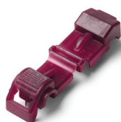
KONEKTOR DO NABÍJECÍ STANICE HUSQVARNA AUTOMOWER® 535 12 90-02