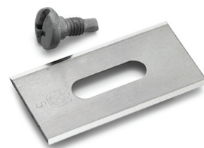
ŽACÍ BŘÍTY AUTOMOWER® ENDURANCE HSS 599 80 52-03