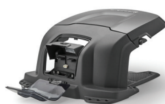
AUTOMOWER® HOUSE L - DOMEČEK PRO AUTOMOWER 587 23 61-01