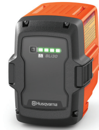
AKUMULÁTOR HUSQVARNA BLI30 967 93 77-01