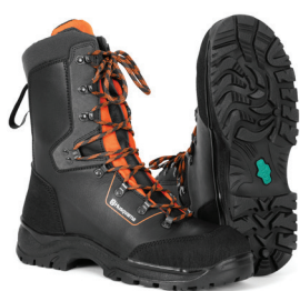
OCHRANNÁ KOŽENÁ OBUV CLASSIC S OCHRANOU PROTI PROŘÍZNUTÍ 597 65 94-39