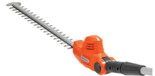
NÁSTAVEC S PLOTOSTŘIHEM HUSQVARNA 529 35 19-02