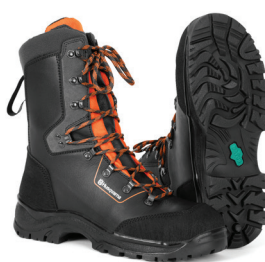
OCHRANNÁ KOŽENÁ OBUV CLASSIC S OCHRANOU PROTI PROŘÍZNUTÍ 597 65 94-40