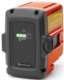
AKUMULÁTOR HUSQVARNA BLI20 967 09 17-01