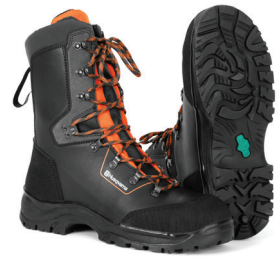
OCHRANNÁ KOŽENÁ OBUV CLASSIC S OCHRANOU PROTI PROŘÍZNUTÍ 597 65 94-45