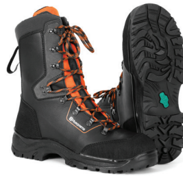
OCHRANNÁ KOŽENÁ OBUV CLASSIC S OCHRANOU PROTI PROŘÍZNUTÍ 597 65 94-44