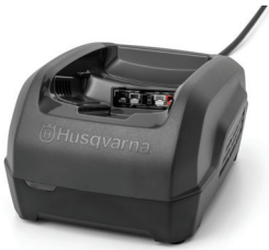
NABÍJEČKA HUSQVARNA QC250 967 97 01-01