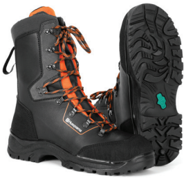
OCHRANNÁ KOŽENÁ OBUV CLASSIC S OCHRANOU PROTI PROŘÍZNUTÍ 597 65 94-42