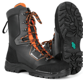
OCHRANNÁ KOŽENÁ OBUV CLASSIC S OCHRANOU PROTI PROŘÍZNUTÍ 597 65 94-43