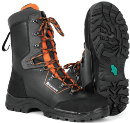
OCHRANNÁ KOŽENÁ OBUV CLASSIC S OCHRANOU PROTI PROŘÍZNUTÍ 597 65 94-46