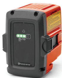
AKUMULÁTOR HUSQVARNA BLi10 967 09 16-01