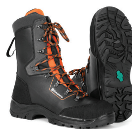
OCHRANNÁ KOŽENÁ OBUV CLASSIC S OCHRANOU PROTI PROŘÍZNUTÍ 597 65 94-41