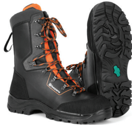
OCHRANNÁ KOŽENÁ OBUV CLASSIC S OCHRANOU PROTI PROŘÍZNUTÍ 597 65 94-47