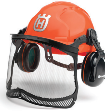
OCHRANNÁ PŘILBA PRO PRÁCI V LESE, CLASSIC 580 75 43-01