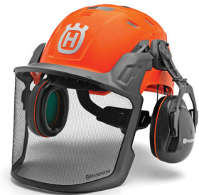
OCHRANNÁ PŘILBA PRO PRÁCI V LESE, TECHNICAL 585 05 84-01