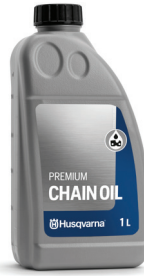
MINERÁLNÍ OLEJ NA MAZÁNÍ LIŠTY A ŘETĚZU 579 39 60-01