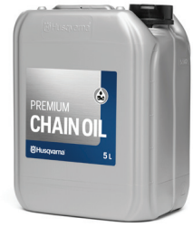
MINERÁLNÍ OLEJ NA MAZÁNÍ LIŠTY A ŘETĚZU 579 39 61-01