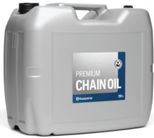
MINERÁLNÍ OLEJ NA MAZÁNÍ LIŠTY A ŘETĚZU 579 39 62-01