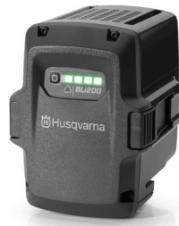
AKUMULÁTOR HUSQVARNA BLI200 967 09 19-01