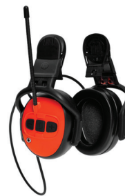
CHRÁNIČE SLUCHU S FM RÁDIEM 578 27 49-04