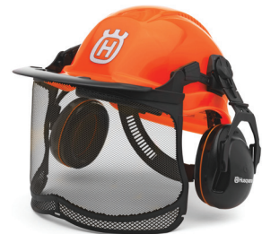
OCHRANNÁ PŘILBA PRO PRÁCI V LESE, FUNCTIONAL 576 41 24-02