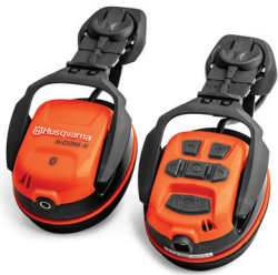
CHRÁNIČE SLUCHU PRO PŘILBU, BT & FM, X-COM R 595 08 42-01