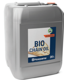
OLEJ X-GUARD BIO HUSQVARNA NA MAZÁNÍ LIŠTY A ŘETĚZU 596 45 73-04