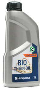
OLEJ X-GUARD BIO HUSQVARNA NA MAZÁNÍ LIŠTY A ŘETĚZU 596 45 73-01