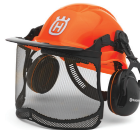
OCHRANNÁ PŘILBA PRO PRÁCI V LESE, FUNCTIONAL 576 41 24-01