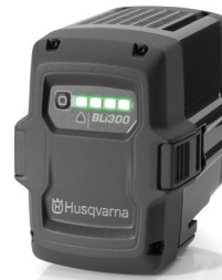
AKUMULÁTOR HUSQVARNA BLI300 967 07 19-01