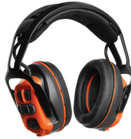
CHRÁNIČE SLUCHU S NÁHLVNÍM OBLOUKEM, X-COM R 595 08 40-01