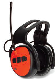
CHRÁNIČE SLUCHU S FM RÁDIEM 578 27 49-03