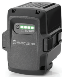
AKUMULÁTOR HUSQVARNA BLI100 967 09 18-01