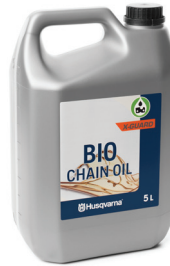
OLEJ X-GUARD BIO HUSQVARNA NA MAZÁNÍ LIŠTY A ŘETĚZU 596 45 73-02