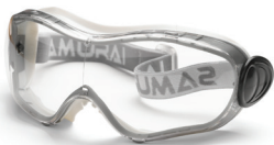
OCHRANNÉ BRÝLE GOGGLES 544 96 39-01