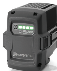
BATERIE HUSQVARNA BL1300 967 07 19-01