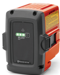
BATERIE HUSQVARNA BL120 967 09 17-01