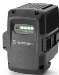
BATERIE HUSQVARNA BL1200 967 09 19-01