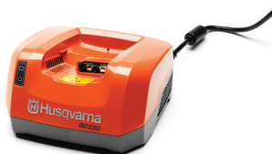
NABÍJEČKA BATERÍ HUSQVARNA QC330 967 09 14-01