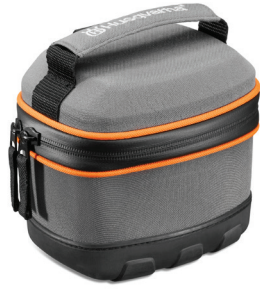
OBAL NA BATERIE HUSQVARNA 585 37 18-01