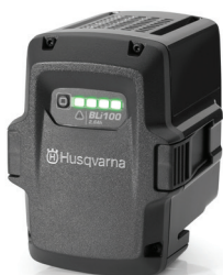
BATERIE HUSQVARNA BL1100 967 09 18-01