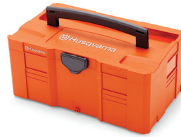
BOX SYSTEMAINER NA BATERIE HUSQVARNA VELKÝ, L 585 42 88-01