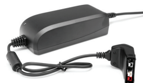
NABÍJEČKA BATERÍ HUSQVARNA QC80 967 33 56-31