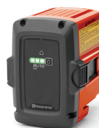
BATERIE HUSQVARNA BL110 967 09 16-01