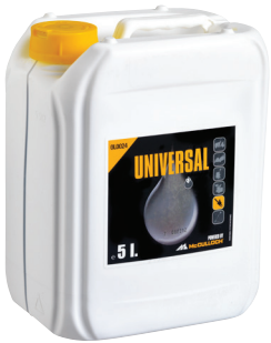
OLO024 - MINERÁLNÍ OLEJ NA MAZÁNÍ ŘETĚZU, 5 L 577 61 64-24