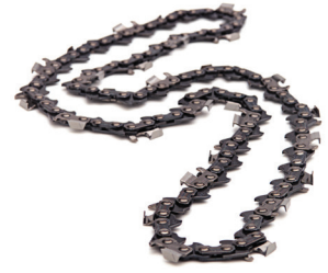
PILOVÝ ŘETĚZ H37 3/8" MINI / 1,3 MM / 40 ČL. 576 93 65-40