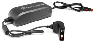
NABÍJEČKA BATERIÍ HUSQVARNA QC80F 967 62 83-01