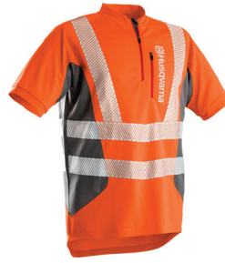
PRACOVNÍ TRIKO S KRÁTKÝM RUKÁVEM TECHNICAL, REFLEXNÍ 596 30 39-50