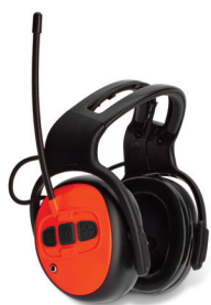
CHRÁNIČE SLUCHU S FM RÁDIEM 578 27 49-03