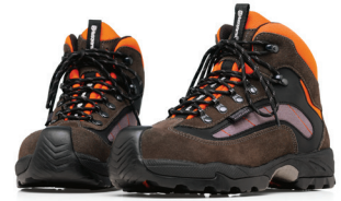
OCHRANNÁ OBUV TECHNICAL 596 30 64-40