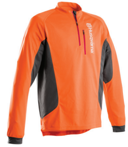
PRACOVNÍ TRIKO S DLOUHÝM RUKÁVEM TECHNICAL 50172 03-62