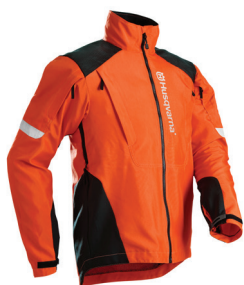
BUNDA TECHNICAL PRO PRÁCI S KŘOVINOŘEZEM NEBO VYŽÍNAČEM 580 68 82-46