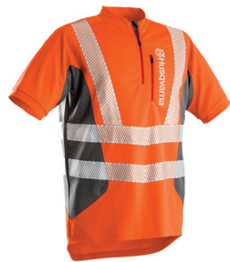
PRACOVNÍ TRIKO S KRÁTKÝM RUKÁVEM TECHNICAL, REFLEXNÍ 50172 05-46