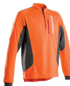
PRACOVNÍ TRIKO S DLOUHÝM RUKÁVEM TECHNICAL 501 72 03-46