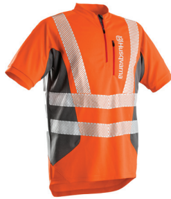
PRACOVNÍ TRIKO S KRÁTKÝM RUKÁVEM TECHNICAL, REFLEXNÍ 596 30 39-62