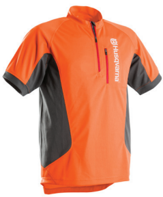
PRACOVNÍ TRIKO S KRÁTKÝM RUKÁVEM TECHNICAL 50171 59-58