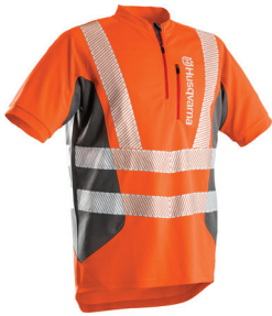
PRACOVNÍ TRIKO S KRÁTKÝM RUKÁVEM TECHNICAL, REFLEXNÍ 596 30 39-58