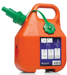
KANYSTR NA BENZÍN, 6 L, ORANŽOVÝ 505 69 80-01