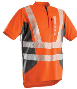
PRACOVNÍ TRIKO S KRÁTKÝM RUKÁVEM TECHNICAL, REFLEXNÍ 596 30 39-66