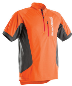
PRACOVNÍ TRIKO S KRÁTKÝM RUKÁVEM TECHNICAL 50171 59-62