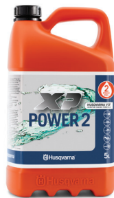
ALKYLÁTOVÉ PALIVO HUSQVARNAHUSQVARNA XP POWER 2T 583 95 29-01