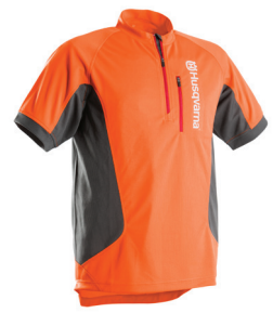
PRACOVNÍ TRIKO S KRÁTKÝM RUKÁVEM TECHNICAL 50171 59-54