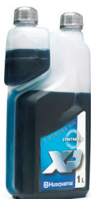
DVOUTAKTNÍ OLEJ, XP® SYNTHETIC 578 18 00-03