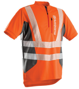
PRACOVNÍ TRIKO S KRÁTKÝM RUKÁVEM TECHNICAL, REFLEXNÍ 596 30 39-54