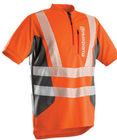
PRACOVNÍ TRIKO S KRÁTKÝM RUKÁVEM TECHNICAL, REFLEXNÍ 50172 05-54