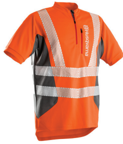
PRACOVNÍ TRIKO S KRÁTKÝM RUKÁVEM TECHNICAL, REFLEXNÍ 596 30 39-46