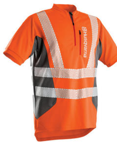
PRACOVNÍ TRIKO S KRÁTKÝM RUKÁVEM TECHNICAL, REFLEXNÍ 50172 05-58