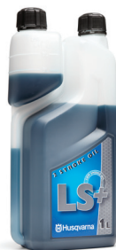
DVOUTAKTNÍ OLEJ, LS+ 578 03 70-02