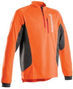
PRACOVNÍ TRIKO S DLOUHÝM RUKÁVEM TECHNICAL 50172 03-50