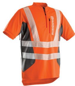
PRACOVNÍ TRIKO S KRÁTKÝM RUKÁVEM TECHNICAL, REFLEXNÍ 50172 05-62