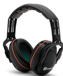
CHRÁNIČE SLUCHU 505 66 53-04