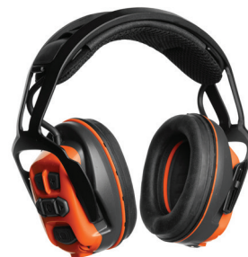
CHRÁNIČE SLUCHU S NÁHLAVNÍM OBLOUKEM, X-COM R 595 08 40-01