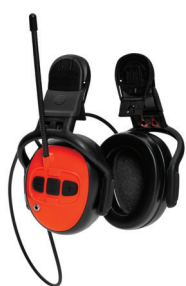
CHRÁNIČE SLUCHU S FM RÁDIEM 578 27 49-04