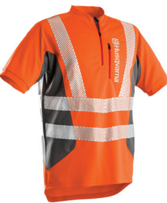
PRACOVNÍ TRIKO S KRÁTKÝM RUKÁVEM TECHNICAL, REFLEXNÍ 50172 05-50