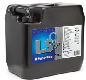
DVOUTAKTNÍ OLEJ, LS+ 578 18 00-02