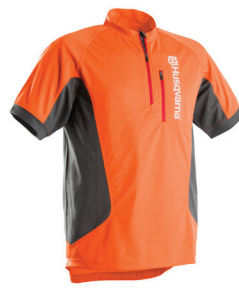
PRACOVNÍ TRIKO S KRÁTKÝM RUKÁVEM TECHNICAL 50171 59-50