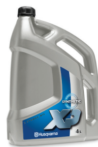
DVOUTAKTNÍ OLEJ, XP® SYNTHETIC 578 03 71-03