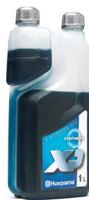
DVOUTAKTNÍ OLEJ, XP® SYNTHETIC 578 03 70-03