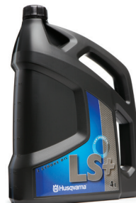
DVOUTAKTNÍ OLEJ, LS+ 578 03 71-02