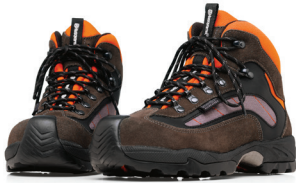
OCHRANNÁ OBUV TECHNICAL 596 30 64-42