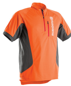
PRACOVNÍ TRIKO S KRÁTKÝM RUKÁVEM TECHNICAL 50171 59-66