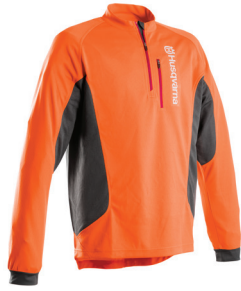
PRACOVNÍ TRIKO S DLOUHÝM RUKÁVEM TECHNICAL 50172 03-54