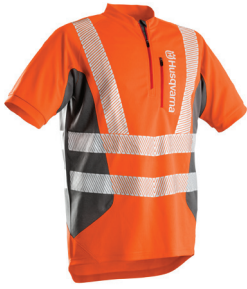
PRACOVNÍ TRIKO S KRÁTKÝM RUKÁVEM TECHNICAL, REFLEXNÍ 501 72 05-66