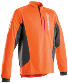
PRACOVNÍ TRIKO S DLOUHÝM RUKÁVEM TECHNICAL 50172 03-66