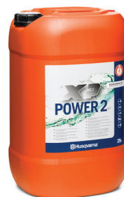
HUSQVARNA XP POWER 2T 583 95 29-02