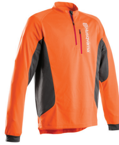
PRACOVNÍ TRIKO S DLOUHÝM RUKÁVEM TECHNICAL 50172 03-58