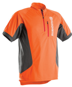
PRACOVNÍ TRIKO S KRÁTKÝM RUKÁVEM TECHNICAL 50171 59-46