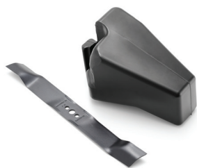
MULČOVACÍ SADA 589 21 49-01