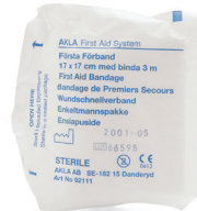
TLAKOVÝ OBVAZ 505 66 52-06