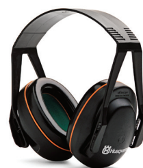
CHRÁNIČE SLUCHU GARDENER 505 69 90-12