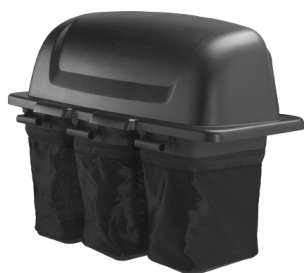
SBĚRNÝ KOŠ CLEAR CUT, PRO MZ/Z400 48", 3 KONTEJNERY 598 53 28-02