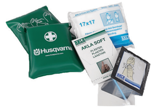
LÉKÁRNIČKA PRVNÍ POMOCI 504 09 53-01