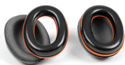
HYGIENICKÁ SADA GARDENER 597 79 52-01