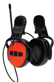
CHRÁNIČE SLUCHU S FM RÁDIEM 578 27 49-04