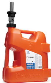
KANYSTR NA BENZÍN 15 LITRŮ 580 75 45-01