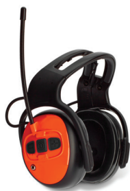
CHRÁNIČE SLUCHU S FM RÁDIEM 578 27 49-03