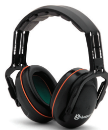
CHRÁNIČE SLUCHU 505 66 53-04