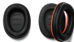
HYGIENICKÁ SADA X-COM R 596 48 94-01