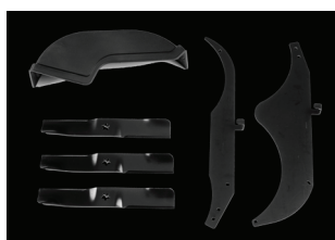
MULČOVACÍ SADA PRO MZ A ZT 400 SERIES, ŽACÍ ÚSTROJÍ 48" CLEAR CUT 582 56 00-01