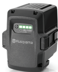
BATERIE HUSQVARNA BLI100 967 09 18-01