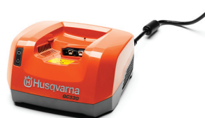
NABÍJEČKA BATERÍ HUSQVARNA QC330 967 09 14-01