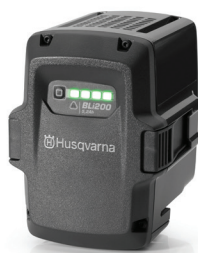
BATERIE HUSQVARNA BLI200 967 09 19-01