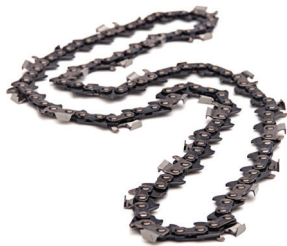
PILOVÝ ŘETĚZ H38 PIXEL 3/8" MINI / 1,1 MM / 45 ČL. 581 80 79-45