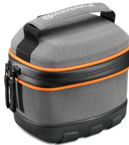
OBAL NA BATERIE HUSQVARNA 585 37 18-01