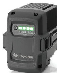
BATERIE HUSQVARNA BLI300 967 07 19-01