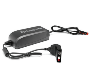
NABÍJEČKA HUSQVARNA QC500 967 09 15-01