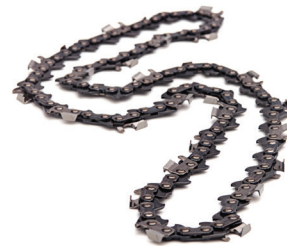
PILOVÝ ŘETĚZ H00 1/4" / 1,3 MM / 68 ČL. 501 84 40-68