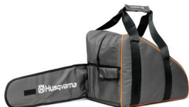
TAŠKA NA ŘETĚZOVOU PILU 576 85 91-01