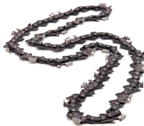
PILOVÝ ŘETĚZ H38 PIXEL 3/8" MINI / 1,1 MM / 52 ČL. 581 80 79-52