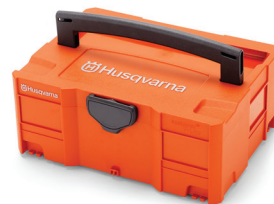
BOX SYSTAINER MALÝ NA BATERIE HUSQVARNA, S 585 42 87-01