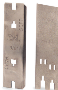
VODÍTKO KULATÉHO PILNÍKU 3/8 HOBBY 505 69 81-03