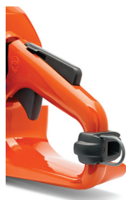
OČKO ZÁVĚSNÉ NA ZADNÍ RUKOJEŤ PILY 578 07 71-01