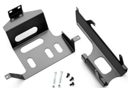
ZADNÍ OCHRANNÝ PLECH 544 06 93-04