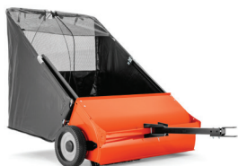
SBĚRNÝ VOZÍK NA TRÁVU, 91 CM 582 71 99-01