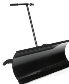
PRYŽOVÁ STÍRACÍ HRANA 531 02 12-40