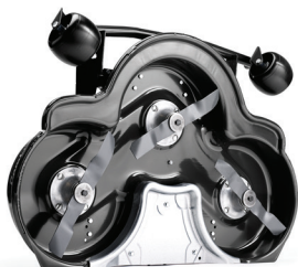
ŽACÍ ÚSTROJÍ COMBI 112 PRO RIDERY 967 18 85-01