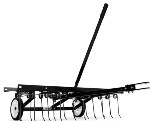
ODMECHOVAČ 586 63 66-01