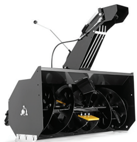
SNĚHOVÁ FRÉZA 967 27 67-01