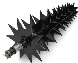
PROVZDUŠŇOVAČ 586 63 69-01