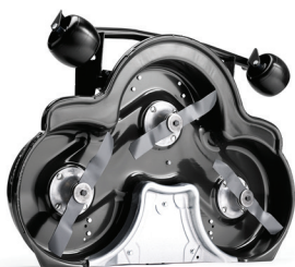
ŽACÍ ÚSTROJÍ COMBI 94 PRO RIDERY 967 15 26-01