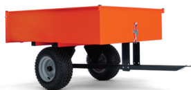
VOZÍK PROFÍ 953 5117-02