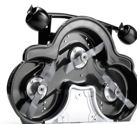
ŽACÍ ÚSTROJÍ COMBI 103 PRO RIDERY 967 15 24-01