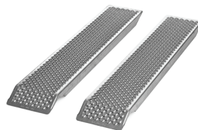
ROVNÉ NÁJEZDY 505 69 90-40