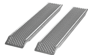
ROVNÉ NÁJEZDY 505 69 90-42