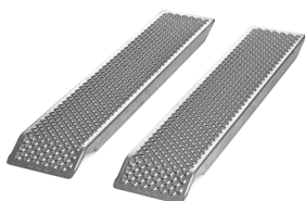
ROVNÉ NÁJEZDY 505 69 90-45