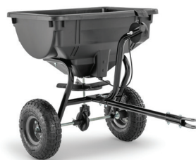
ROZMETADLO SPREADER 30 589 40 93-01