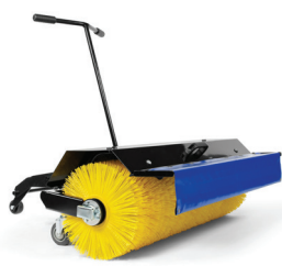
ROTAČNÍ KARTÁČ 587 02 46-01