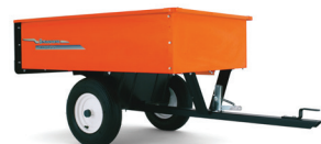
VOZÍK 275 501 00 82-01