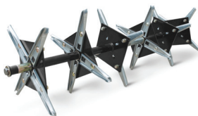
PROVZDUŠŇOVAČ 588 21 27-01