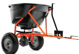
ROZMETADLO SPREADER 75 967 02 72-01