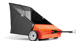
SBĚRNÝ VOZÍK NA TRÁVU, 112 CM 586 63 65-01