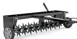
PROVZDUŠŇOVAČ 586 63 67-02