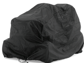
PLACHTA NA RIDER 505 63 08-70