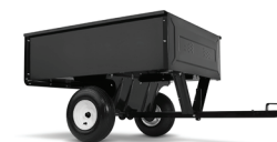
VOZÍK PROMO 967 02 71-01