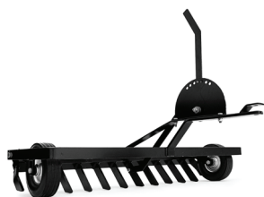
BRÁNY NA ŠTĚRK 953 51 24-01