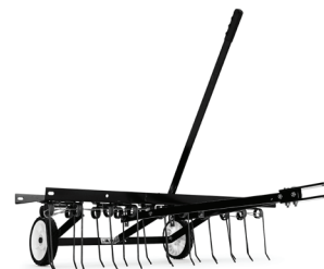
ODMECHOVAČ 586 63 66-01