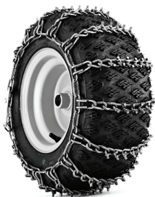
SNĚHOVÉ ŘETĚZY S NAVAŘENÝMI VÁLEČ HROTY, TRO034 964 99 43-01