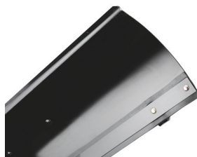
PRYŽOVÁ STÍRACÍ HRANA 966 00 19-01