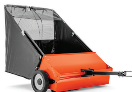
SBĚRNÝ VOZÍK NA TRÁVU, 91 CM 582 71 99-01