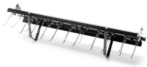
ODMECHOVACÍ HŘÍDEL 586 63 68-01