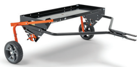
NOSNÝ RÁM PŘÍSLUŠENSTVÍ 586 63 72-01