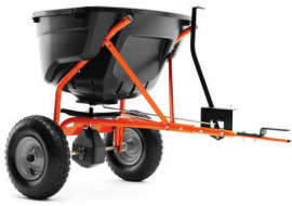
ROZMETADLO SPREADER 75 967 02 72-01