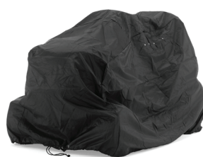
OCHRANNÝ RÁM PRO ZAHRADNÍ TRAKTORY 505 56 88-13 PLACHTA NA TRAKTOR 505 63 08-82