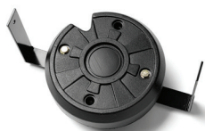
PROTIZÁVAŽÍ PRO MODELY CT A CTH TWIN 580 38 97-01