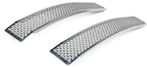
OBLOUKOVÉ NÁJEZDY 505 69 90-41