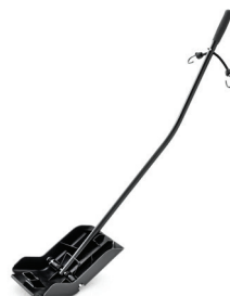
MULČOVACÍ UCPÁVKA TRO060 960 71 00-38