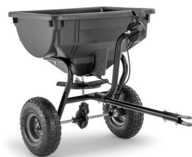
ROZMETADLO SPREADER 30 589 40 93-01