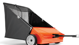
SBĚRNÝ VOZÍK NA TRÁVU, 112 CM 586 63 65-01