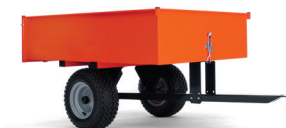
VOZÍK PROFI 953 5117-02