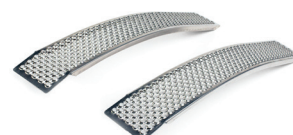
OBLOUKOVÉ NÁJEZDY 505 69 90-43