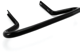
NÁRAZNÍK NA TRAKTOR 954 12 00-49