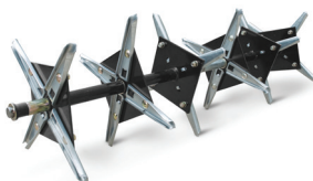
PROVZDUŠŇOVACÍ HŘÍDEL 588 21 27-01