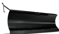
SNĚHOVÁ RADLICE PRO ZAHRADNÍ TRAKTORY 544 92 17-01