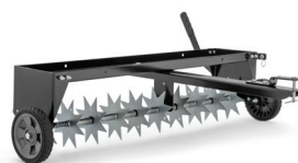
PROVZDUŠŇOVACÍ HŘÍDEL 586 63 69-01