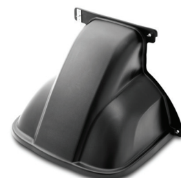
DEFLEKTOR 960 71 00-41