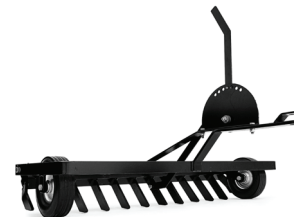
BRÁNY NA ŠTĚRK 953 51 24-01