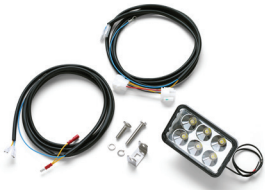
SADA REFLEKTORŮ 581 12 54-01