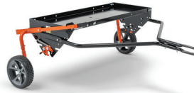
NOSNÝ RÁM PŘÍSLUŠENSTVÍ 586 63 72-01