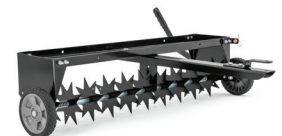
PROVZDUŠŇOVAČ 586 63 67-02