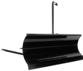
SNĚHOVÁ RADLICE KOVA 965 07 09-01