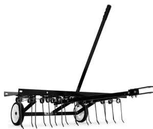
ODMECHOVAČ 586 63 66-01