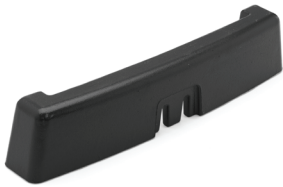
PROTIZÁVAŽÍ 953 53 49-01