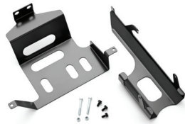
ZADNÍ OCHRANNÝ PLECH 544 06 93-04