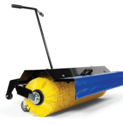
ROTAČNÍ KARTÁČ 587 02 47-01