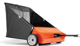
SBĚRNÝ VOZÍK NA TRÁVU, 112 CM