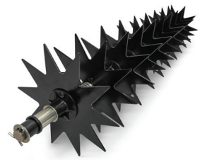
PROVZDUŠŇOVAČ 586 63 69-01