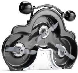
ŽACÍ ÚSTROJÍ COMBI 94 PRO RIDERY 967 15 22-01