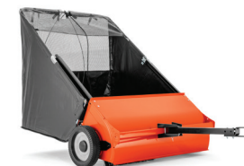
SBĚRNÝ VOZÍK NA TRÁVU, 91 CM 582 71 99-01