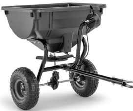
ROZMETADLO SPREADER 30 589 40 93-01