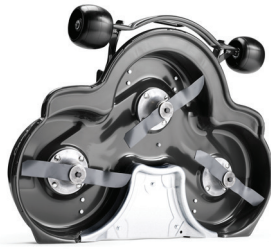
ŽACÍ ÚSTROJÍ COMBI 103 PRO RIDERY 967 15 23-01