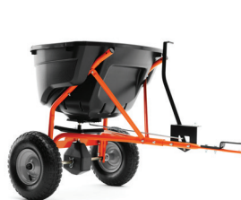
ROZMETADLO SPREADER 75 967 02 72-01