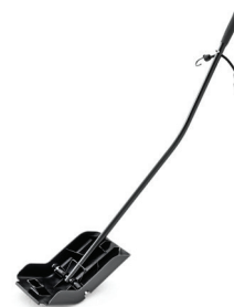
MULČOVACÍ UCPÁVKA TRO060 960 71 00-38