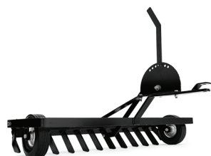
BRÁNY NA ŠTĚRK 953 51 24-01