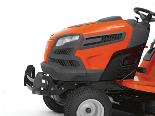
OCHRANNÝ RÁM 505 56 88-13