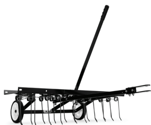
ODMECHOVAČ 586 63 66-01