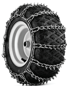
SNĚHOVÉ ŘETĚZY S NAVAŘENÝMI VÁLEČ HROTY, TRO034 964 99 43-01