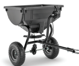
ROZMETADLO SPREADER 30 589 40 93-01