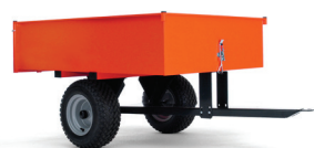
VOZÍK PROFI 953 51 17-02