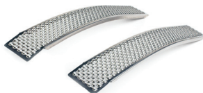
OBLOUKOVÉ NÁJEZDY 505 69 90-43