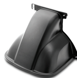
DEFLEKTOR 960 71 00-41