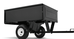
VOZÍK PROMO 967 02 71-01