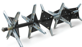
PROVZDUŠNOVAČ 588 21 27-01