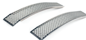
OBLOUKOVÉ NÁJEZDY 505 69 90-41