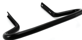
NÁRAZNÍK NA TRAKTOR 954 12 00-49