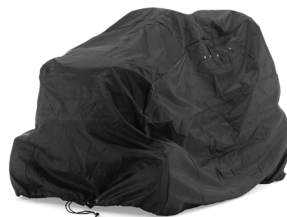
PLACHTA NA TRAKTOR 505 63 08-82