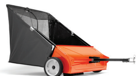
SBĚRNÝ VOZÍK NA TRÁVU, 112 CM 586 63 65-01