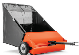
SBĚRNÝ VOZÍK NA TRÁVU, 91 CM 582 71 99-01