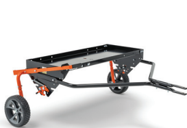
NOSNÝ RÁM PŘÍSLUŠENSTVÍ 586 63 72-01