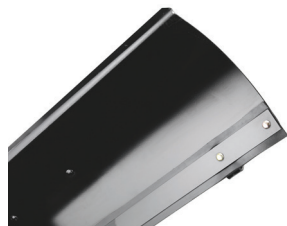
PRYŽOVÁ SHRNOVACÍ HRANA, TRO059 966 00 19-01