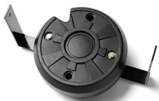
PROTÍZÁVAŽÍ PRO MODELY CT A CTH TWIN 580 38 97-01