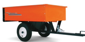
VOZÍK 275 501 00 82-01