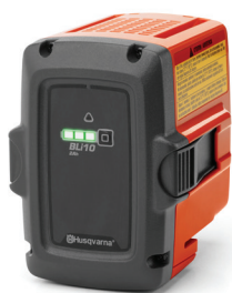
BATERIE HUSQVARNA BLI10 967 09 16-01