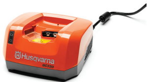
NABÍJEČKA BATERÍ HUSQVARNA QC330 967 09 14-01