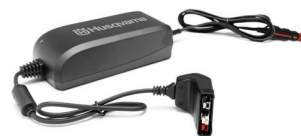
NABÍJEČKA HUSQVARNA QC500 967 09 15-01