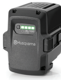
BATERIE HUSQVARNA BLI100 967 09 18-01