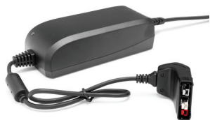
NABÍJEČKA BATERÍ HUSQVARNA QC80 967 33 56-31