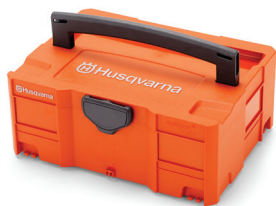
BOX SYSTEMER MALÝ NA BATERIE HUSQVARNA, S 585 42 87-01