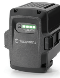
BATERIE HUSQVARNA BLI200 967 09 19-01