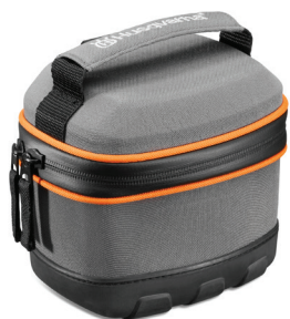
OBAL NA BATERIE HUSQVARNA 585 37 18-01