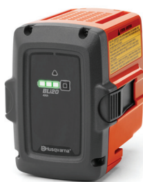
BATERIE HUSQVARNA BLI20 967 09 17-01